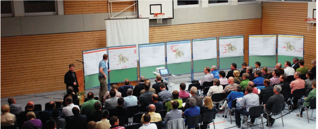
Vorstellung der Ergebnisse aus den Arbeitsgruppen