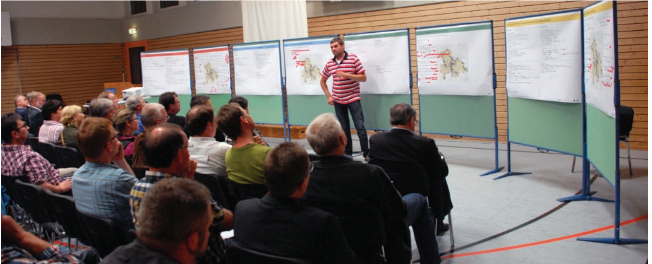
Vorstellung der Ergebnisse aus den Arbeitsgruppen