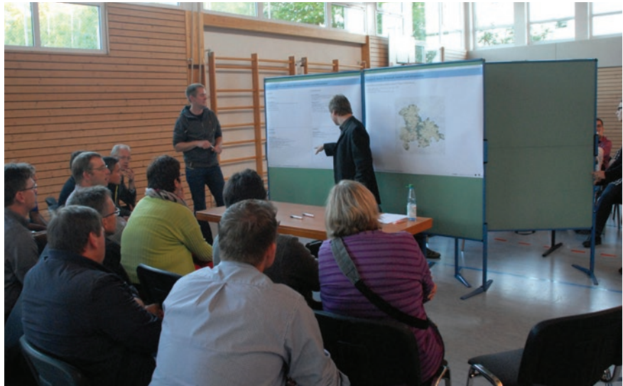
Gruppe 2: Arbeit, Wirtschaft, Verkehr und Infrastruktur