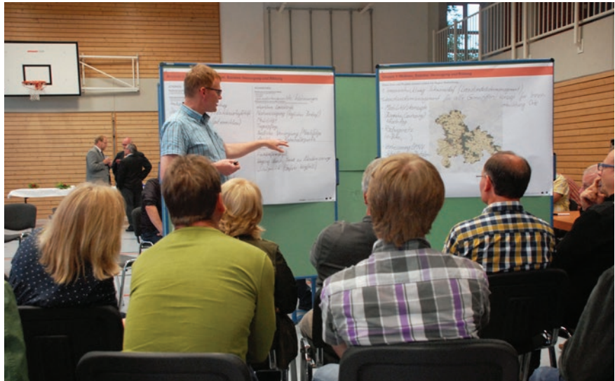
Gruppe 1: Wohnen, Soziales, Versorgung und Bildung