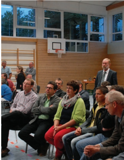
Gruppe 3: Freizeit, Tourismus und Kulturlandschaft