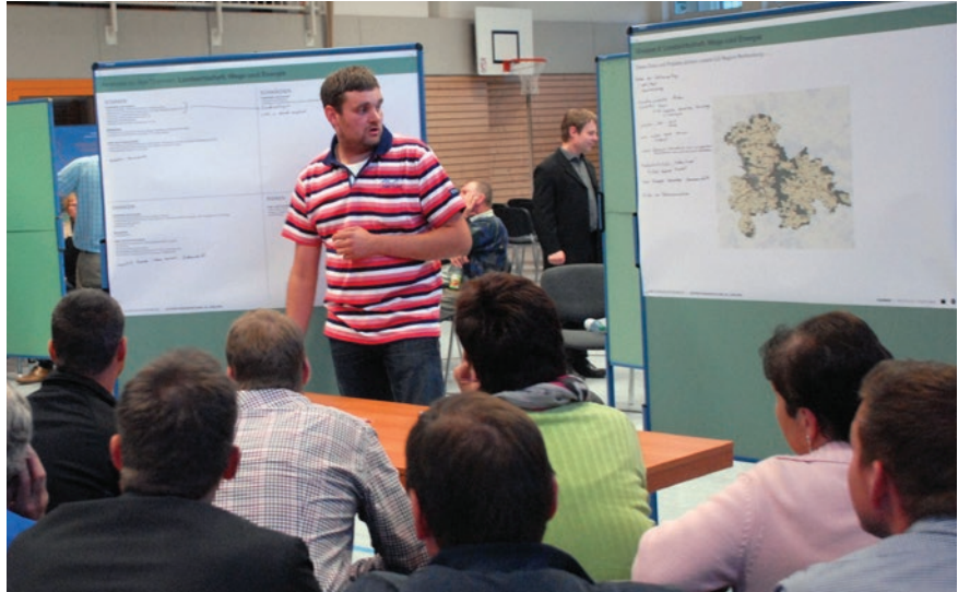
Gruppe 4: Landwirtschaft, Kernwege und Energie