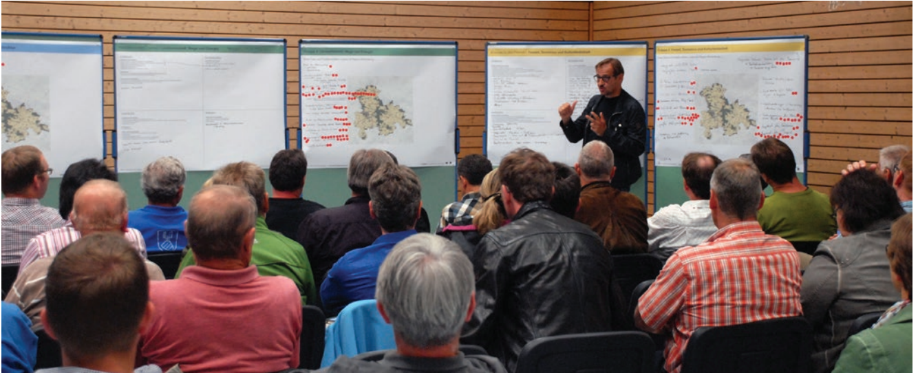
Vorstellung der Ergebnisse aus den Arbeitsgruppen